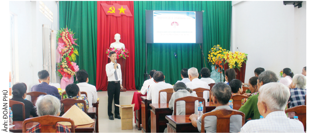
Đoàn Luật sư thành phố Đồng Nai phối hợp với xã Phú Hòa tuyên truyền pháp luật về bình đẳng giới cho người dân.

Phạt tiền từ 4-7 triệu đồng đối với hành vi dùng vũ lực cản trở người sáng tác, phê bình văn học, nghệ thuật, biểu diễn hoặc tham gia hoạt động văn hóa khác, hoạt động thể dục, thể thao vì định kiến giới; không cho người khác sáng tác, phê bình văn học, nghệ thuật, biểu diễn hoặc tham gia