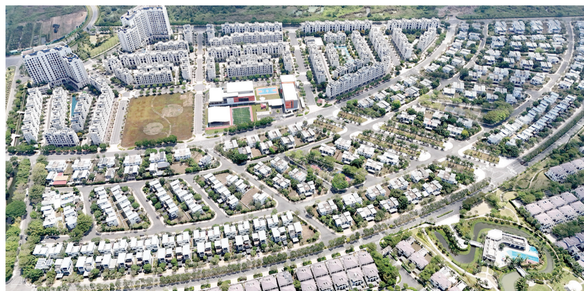
Trong quy hoạch, thành phố Đồng Nai định hướng xây dựng, phát triển các đô thị xứng tầm vị thế.