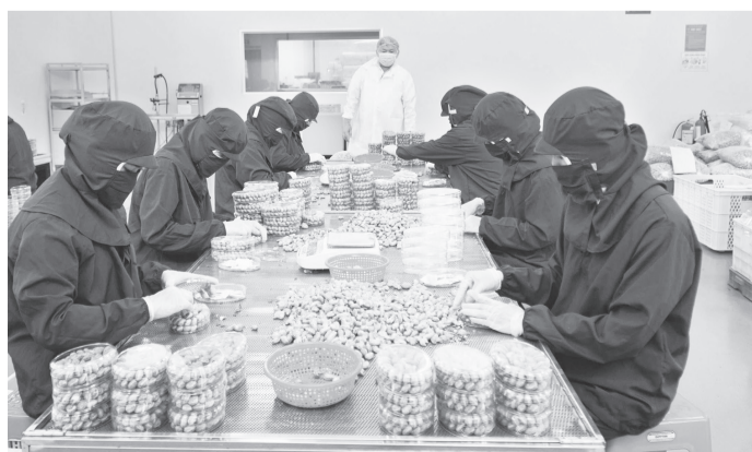
Sản xuất hạt điều Bà Tư đạt OCOP 4 sao luôn đảm bảo quy trình nghiêm ngặt.

Đến nay, Đồng Nai có hơn 450 sản phẩm đạt chứng nhận OCOP của hơn 270 chủ thể. Trong đó có 11 sản phẩm OCOP 5 sao, 89 sản phẩm OCOP 4 sao, còn lại là OCOP 3 sao. Chủ yếu thuộc nhóm sản phẩm như: thực phẩm, đồ uống, dược liệu và sản phẩm từ dược liệu, thủ công mỹ nghệ, dịch vụ du lịch sinh thái và điểm du lịch.