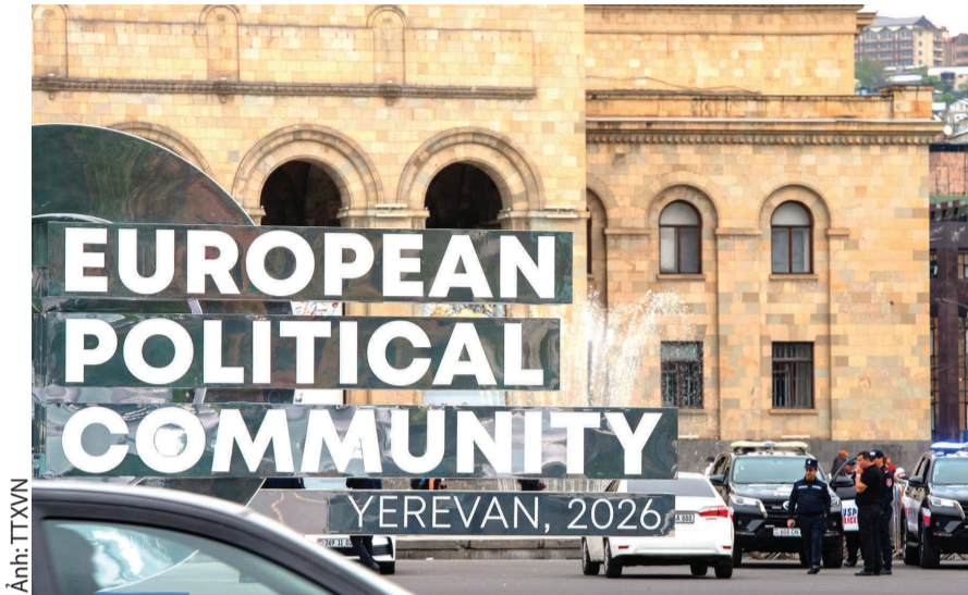
An ninh được thắt chặt trước thềm Hội nghị thượng đỉnh Armenia - EU và Hội nghị thượng đỉnh Cộng đồng Chính trị châu Âu (EPC) tại Yerevan, Armenia, ngày 3-5-2026.

Theo EU, sự kiện nhằm tái khẳng định "cam kết mạnh mẽ đối với chủ quyền, khả năng phục hồi và chương trình cải cách của Armenia". Hai bên dự kiến thúc đẩy hợp tác