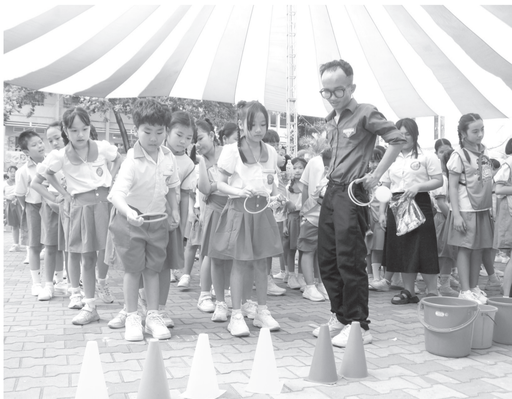
Các em học sinh Trường Tiểu học Nguyễn Du (phường Trảng Bàng) tham gia các trò chơi dân gian tại Ngày hội thiếu nhi vui khỏe - Tiến bước lên Đoàn năm 2026.