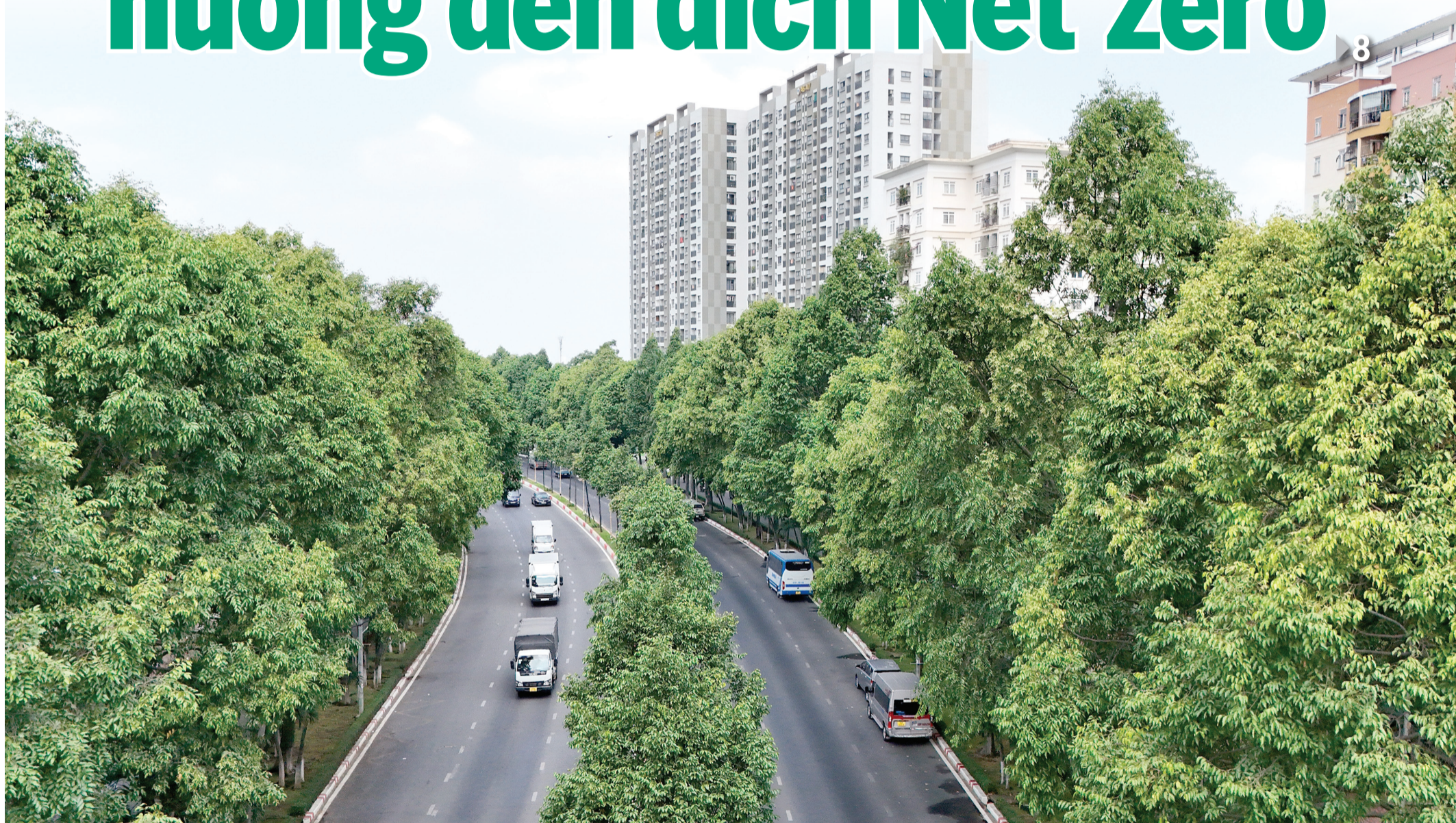
Đồng Nai đặt mục tiêu đạt Net zero vào năm 2050. Trong ảnh: Một khu đô thị nhiều cây xanh tại phường Trấn Biên.