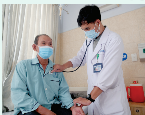
Bác sĩ Bệnh viện Đa khoa Đồng Nai thăm khám cho bệnh nhân bị bệnh tim mạch.

Y tế Đồng Nai: Từ đột phá thể chế đến nâng tầm an sinh ▶11